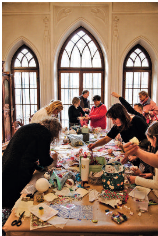
Choinka i wspólne tworzenie ozdób - 2020