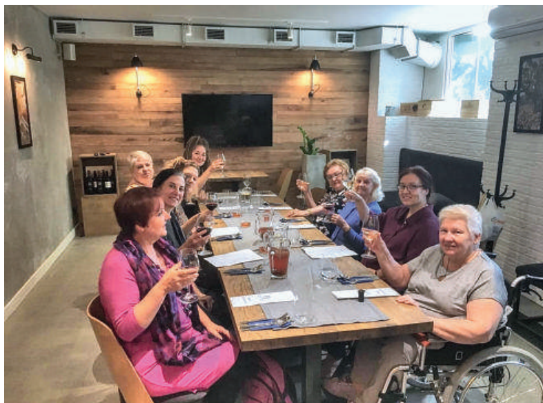
Obiad seniorów w Mokolove - pierwszy toast - 2019