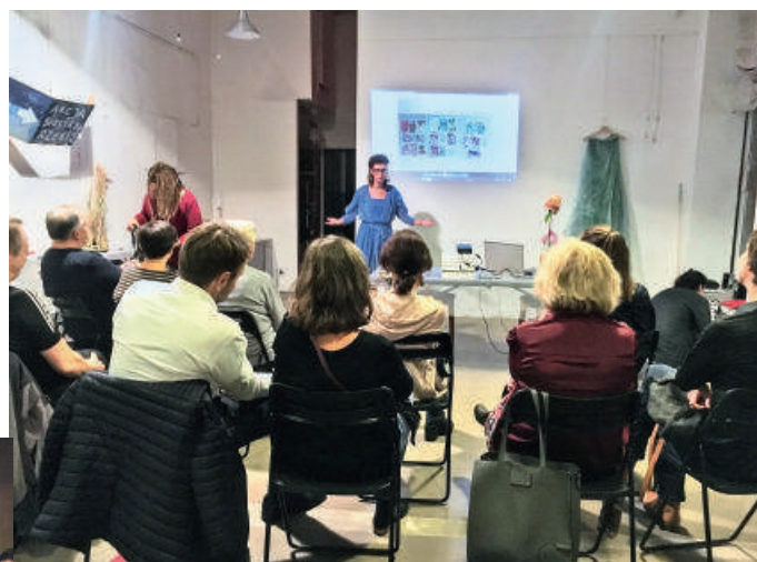
Spotkania z ciekawym człowiekiem - 2019