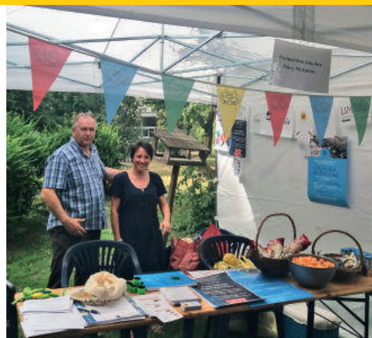
Stoisko Partnerstwa "Stary Mokotów" - 2018