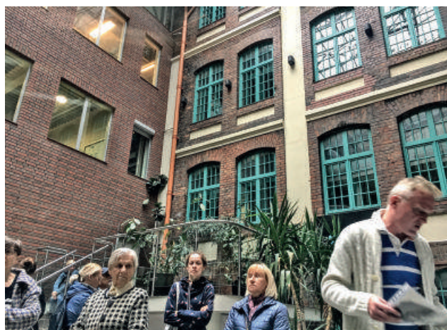
Spacer z przewodnikiem po Mokotowie - 2020