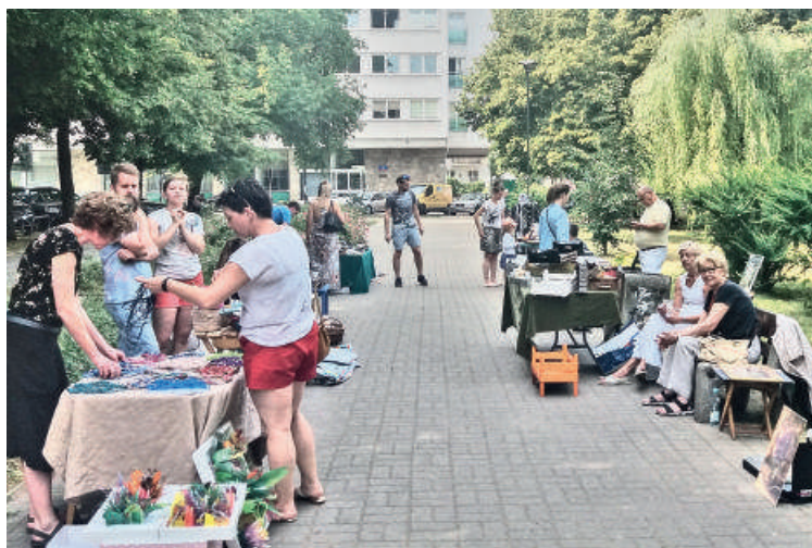
Dzień Sąsiada - 2018