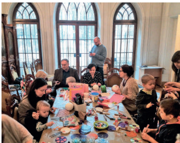
Przygotowywanie ozdób choinkowych w Pałacu Szustra - 2018