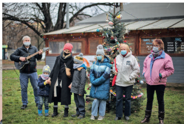
Kolędowanie i strojenie choinki na Skwerze „Orszy” - 2020