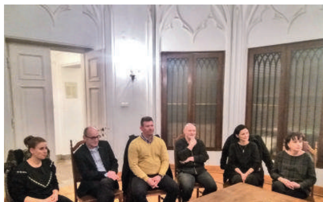
Sąsiedzka Kawiarenka Dyskusyjna - 2019