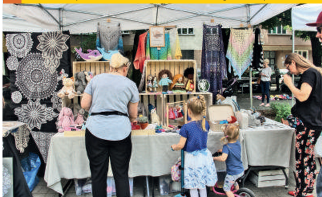
... oraz Targi Rękodzieła - 2019