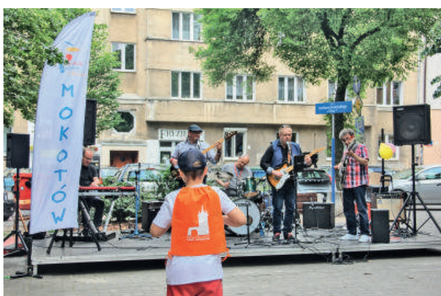
10 Urodziny Skweru Stanisława Broniewskiego „Orszy”...